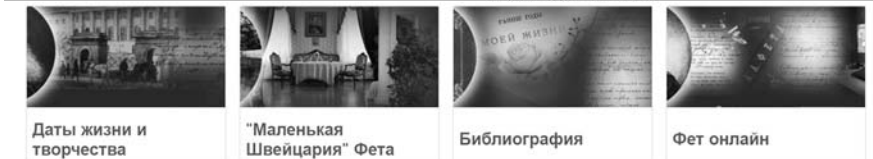
Онлайн-коллекция «Афанасий Афанасьевич Фет»

лю возможность познакомиться с биографией автора, библиографией его изданий, с рядом видеосюжетов, полистать книги онлайн, посмотреть галереи книжных иллюстраций, ответить на вопросы онлайн викторин, посетить виртуальные экскурсии.