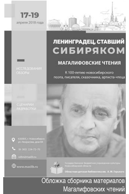
Обложка сборника материалов Магалифовских чтений