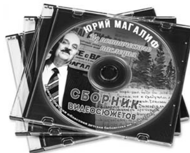
Сборник видеосюжетов «Из поэтического наследия Юрия Магалифа»