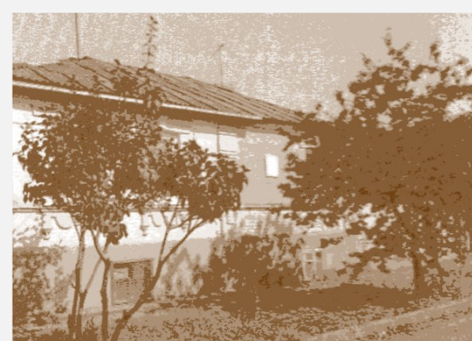
Дом в Ессентуках, где родился поэт