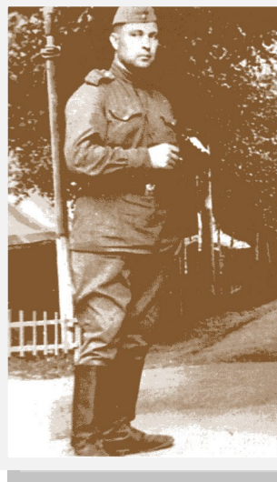
А. Т. Губин в армии

Губин, А. Юнг и Зунга : [повесть о любви] / А. Губин // Литературное Ставрополье. - 2012.– №1. - С.21-46.