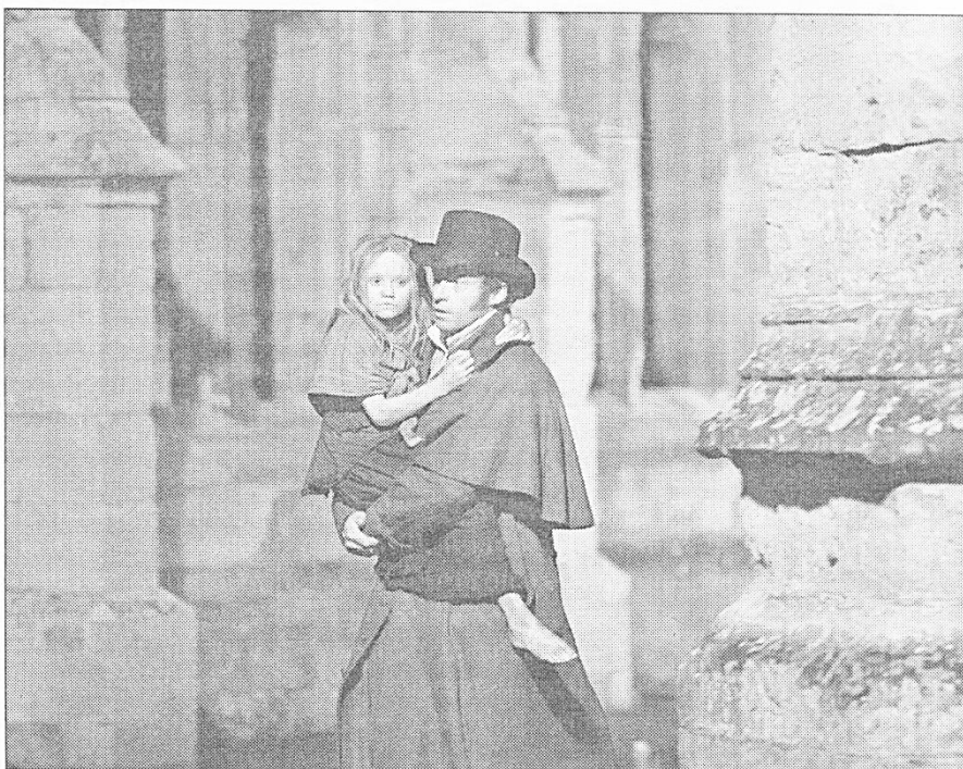
Жан Вальжан (Х. Джекман) спас маленькую Козетту (И. Аллен), забрав от алчного трактирщика Тенардьё. Фильм «Отверженные». Великобритания, режиссёр Т. Хупер. 2012 г.

(Гаврош задаёт вопросы и предлагает три варианта ответа. Ребята отвечают, за верные ответы получая жетоны.)