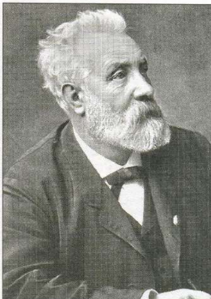
Жюль Верн. 1870-е гг.

ВЕДУЩИЙ: «Таинственный остров» — лучший из романов писателя, который относится к «робинзономадам», — был задуман ещё до того, как Верн стал знаменитым. К началу 1860-х гг. относится незавершённая рукопись — первый, ещё очень слабый, набросок