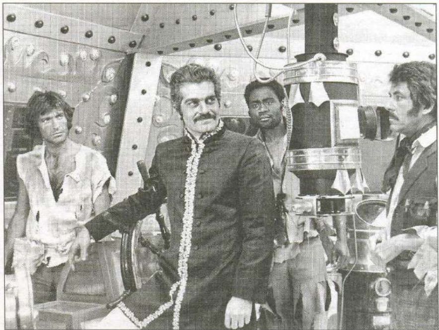
Путешественники, оказавшись на борту «Наутилуса», с интересом слушали рассказ капитан Немо (О. Шариф) о создании и устройстве подводного корабля. Фильм «Таинственный остров». Испания — Франция — Италия — Камерун, режиссёры Х.А. Бардем, А. Кольпи. 1973 г.

Вы, наверное, помните, что роман «Таинственный остров» на-