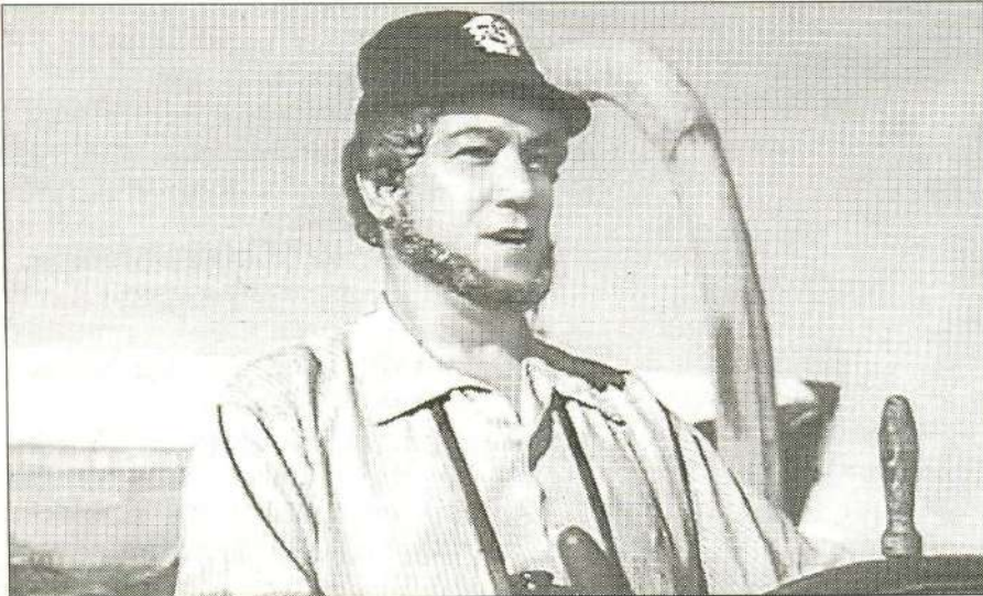
Опытный капитан «Пилигрима» Гуль (А. Хвыля) с пятью матросами, сев в небольшую лодку, отправились на ловлю кита... и погибли

ведение писалось, он ещё не был открыт, и литератор представлял его действующим вулканом, расположившимся в центре моря.