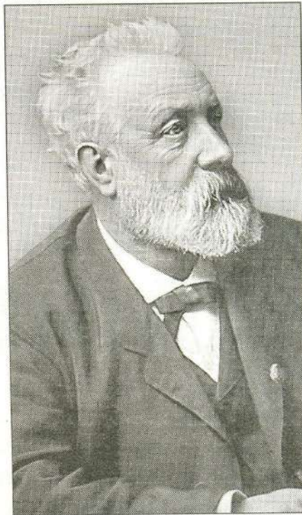
Жюль Верн мог писать более 15 часов подряд. Если романиста постигло озарение, его остановить было невозможно. 1893 г.

ВИТЯ (зрителям): Эй, для кого романтика не просто слово, кто мечтает своими глазами уви-