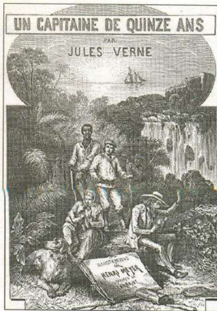
Иллюстрация к роману «Пятнадцатилетний капитан». Художник А. Мейер. 1877 г.

4. «Это крупная птица, ростом коло двух метров, с прямым