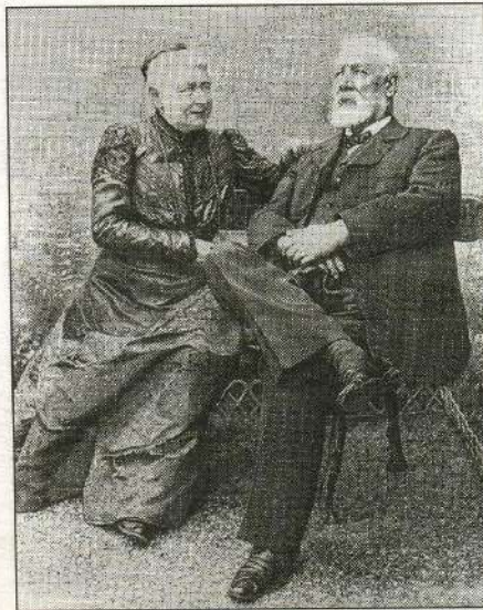
Жюль Верн с супругой Онориной. 1900-е гг.

3. Один из жизненных девизов Ж. Верна звучал так: «Праздность для меня — это...» Закончите фразу.