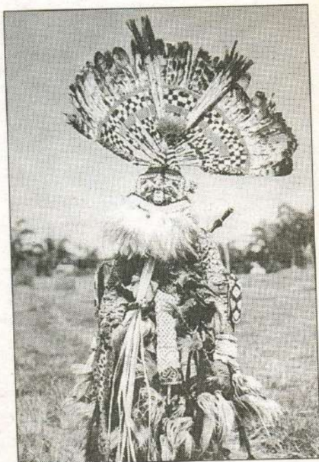
Африканский шаман. Фото начала XX в.

ЛИТЕРАТУРОВЕД: Большое спасибо, друзья! Видно, что вы очень внимательно читали роман!