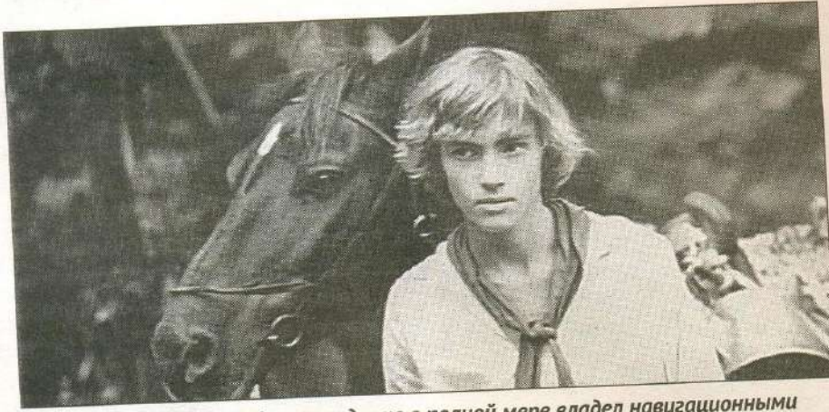
Дик Сэнд (В. Ходченко) был молод и не в полной мере владел навигационными знаниями, но это не помешало ему в трудную минуту взять на себя руководство шхуной. Фильм «Капитан «Пилигрима». Режиссёр А. Праченко. 1986 г.