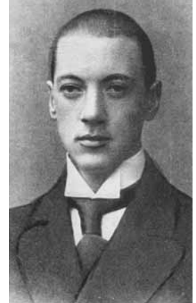
○ Н. С. Гумилёв-гимназист. 1912 г.

ЧТЕЦ (3): «Конквистадор» завоёвывал не земли, не страны, а новую любовь, вплетая в «воинственный наряд звезду долин,