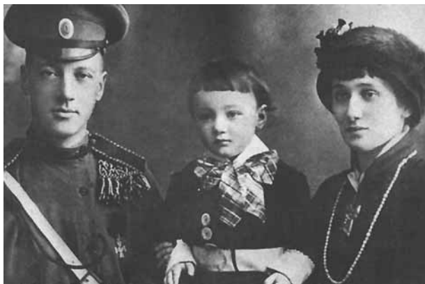
○ Н. С. Гумилёв и А. А. Ахматова с сыном Львом. 1915 г.

ЧТЕЦ (2): О встречах с Анной Ахматовой вспоминает её знакомая: «Мы много говорили на разные темы. Она читала стихи,