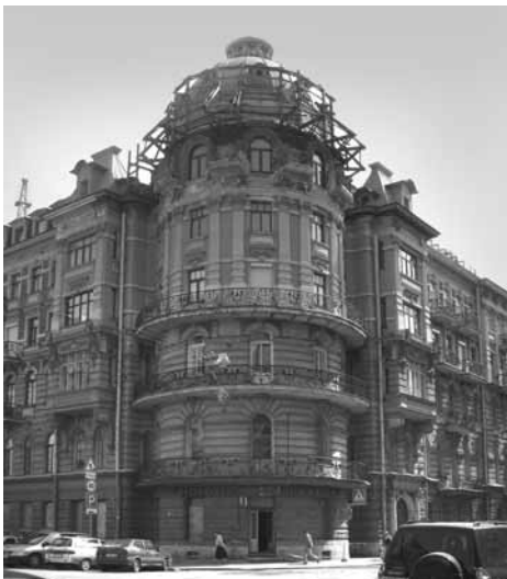
○ «Башня» Вячеслава Иванова (Доходный дом Дернова). Санкт-Петербург, Таврическая улица, дом 35

ЧТЕЦ (2): В мае 1918 года Николай Степанович вернулся в революционный Петроград. Здесь он окунулся в напряжённую литературную атмосферу. Стал читать лекции в Институте истории искусств, участвовал в редколлегии «Всемирной литературы», основанной Максимом Горьким.