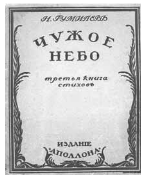
○ Гумилёв Н. «Чужое небо». Третья книга стихов (СПб.: Аполлон, 1912)

ВЕДУЩИЙ: В «Письмах о русской поэзии» Гумилёв говорит о внимании к слову, его возможностях. О чём бы он ни писал, чьё