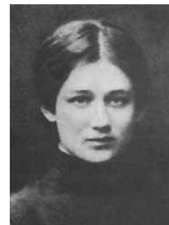
○ Аня Горенко (Ахматова), гимназистка