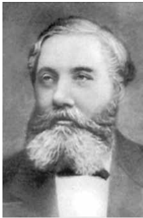
○ Степан Яковлевич Гумилёв (1836–1920) – отец Николая Гумилёва

Сады моей души всегда узорны, В них ветры так свежи и тиховейны, В них золотой песок и мрамор чёрный, Глубокие, прозрачные бассейны.