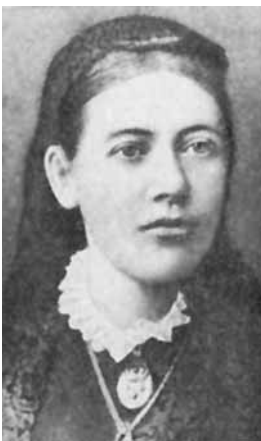
○ Анна Ивановна Гумилёва (Львова) (1854–1942) – мать Николая Гумилёва

ЧТЕЦ (1): Николай Степанович Гумилёв родился 15 апреля 1886 года в городе Кронштадте, где его отец Степан Яковлевич Гумилёв служил корабельным врачом. Николай был ещё ребёнком, когда отец вышел в отставку, и семья переселилась в Царское Село (жили в доме 42 по улице Московской). Своё образование Гумилёв начал