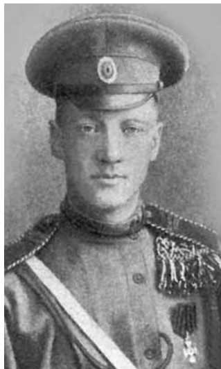
○ Н. С. Гумилёв с Георгиевским крестом