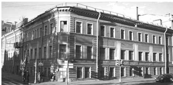
○ Здание бывшей гимназии и реального училища Я. Г. Гуревича (Санкт-Петербург, Лиговский проспект, дом 1, – Озёрной переулок, дом 14, – улица Некрасова, дом 43)

лилию голубую». Гумилёв не столько чувствовал себя первооткрывателем прекрасного, сколько стремился приблизить возможную гармонию.