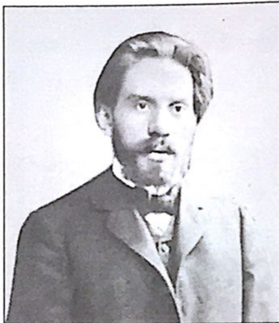
Степан Писахов. 1920-е гг.

Степан Григорьевич преподавал рисование в школах города. Ученики, очень любившие его сказки, часто спрашивали учителя, откуда он берёт темы и сюжеты для своих историй. Он всегда отвечал: «С натуры. Рифмы запросто со мной живут, две при-