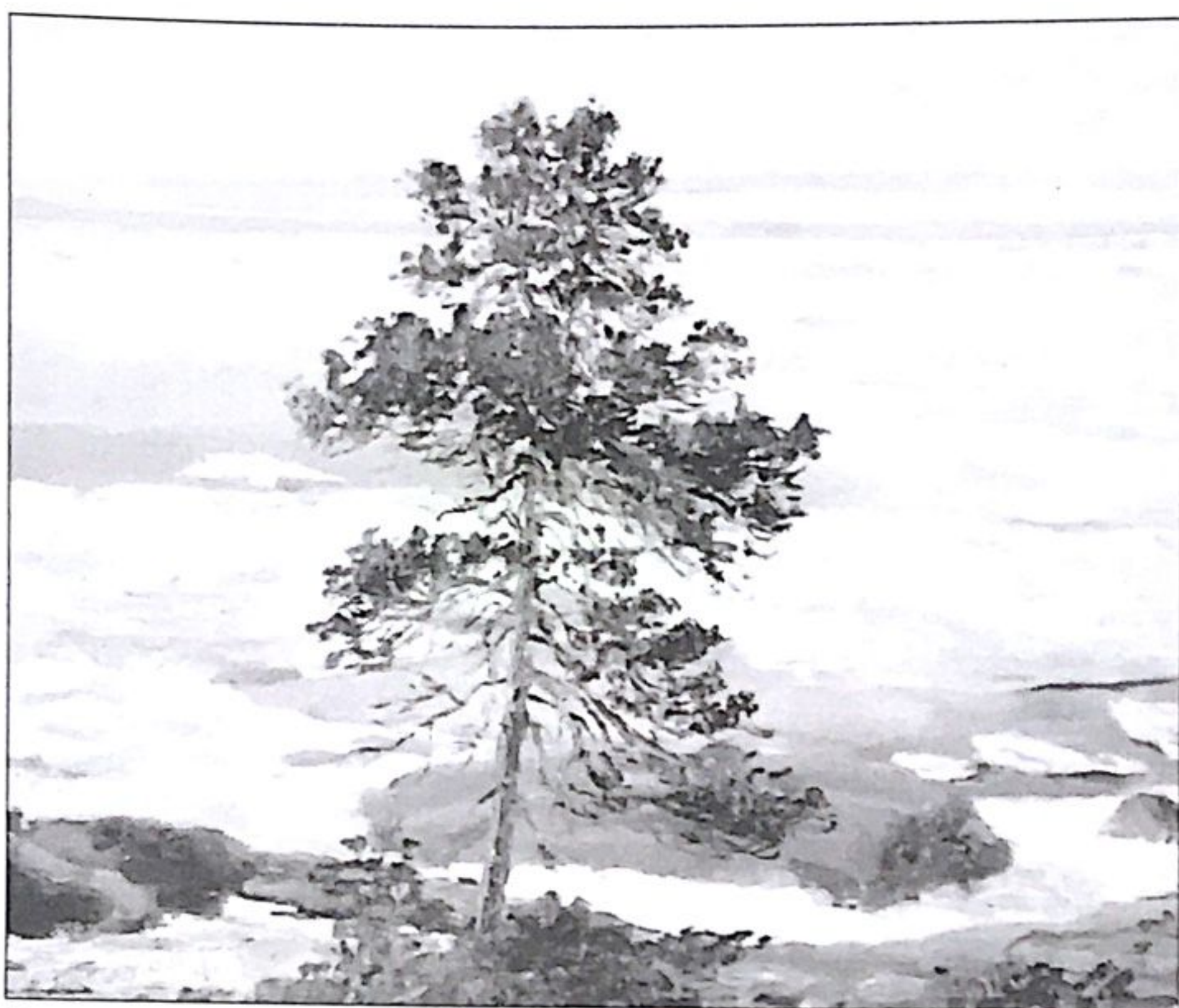
Весна в Белом море. Художник С. Писахов. 1910-е гг.

3. Главный герой, от лица которого ведётся рассказ. (Малина.)