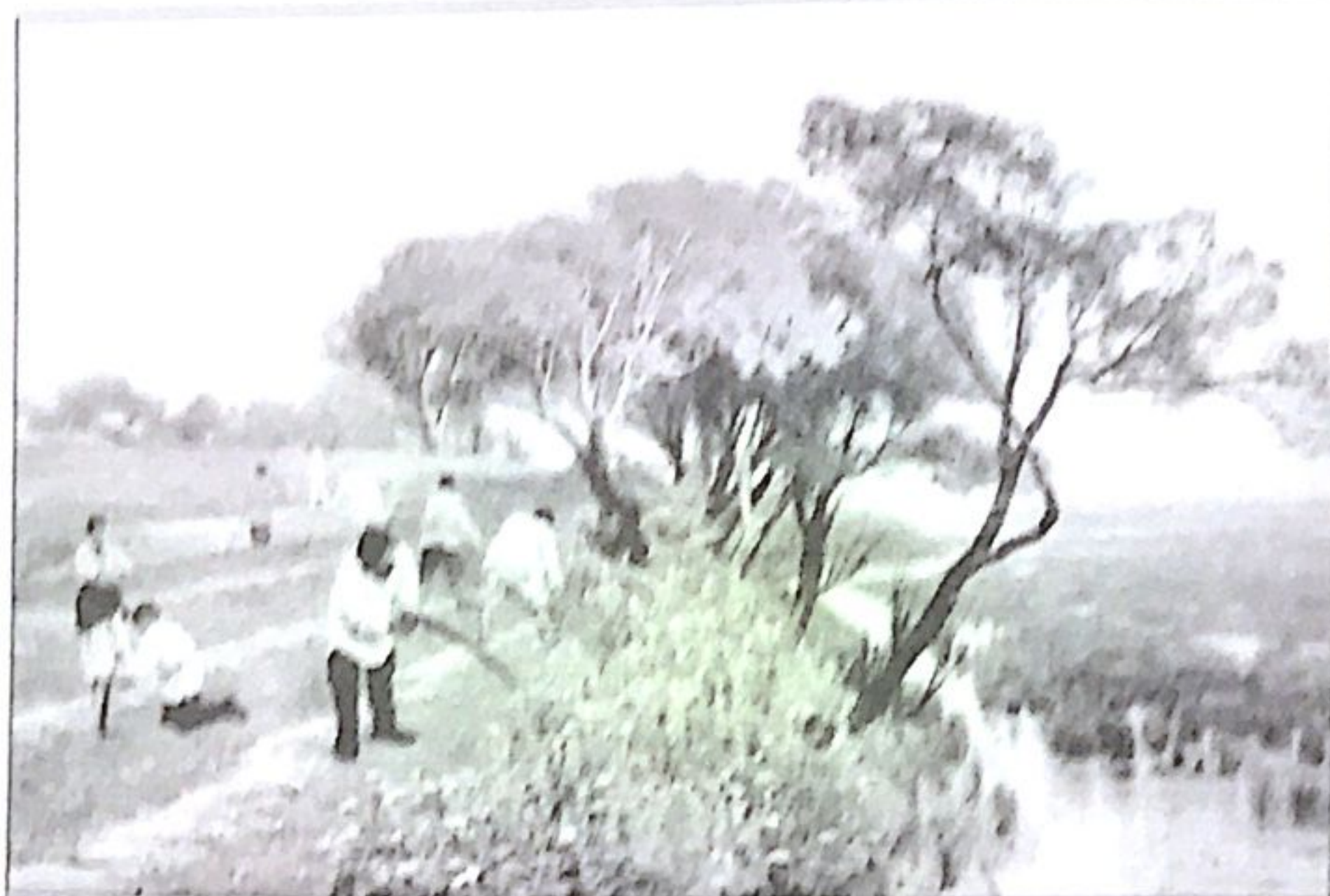
Косари. Художник В. Орловский. 1878 г.

Образ жизни отразился на творчестве поэта: он создал цикл стихотворений «Москва кабацкая». Из лирики исчезли жизнерадостность и деревенские зарисовки, на смену пришли мрачные пейзажи ночного города, где бродит потерянный герой.