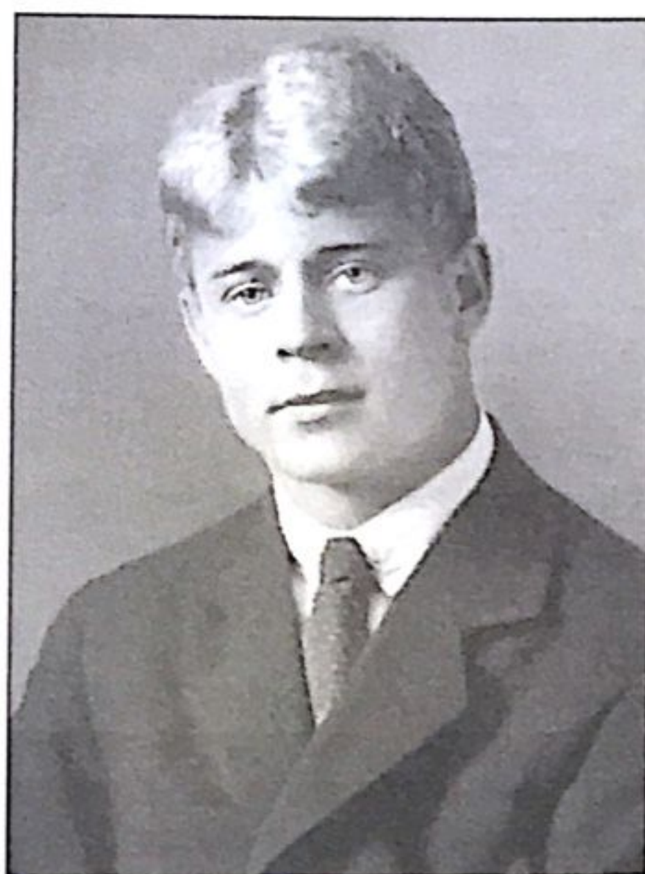
Сергей Есенин. 1920-е гг.

Но внук учёбы этой Не постиг. И, к горечи твоей, Ушёл в страну чужую. По-твоему, теперь Бродягою брожу я,