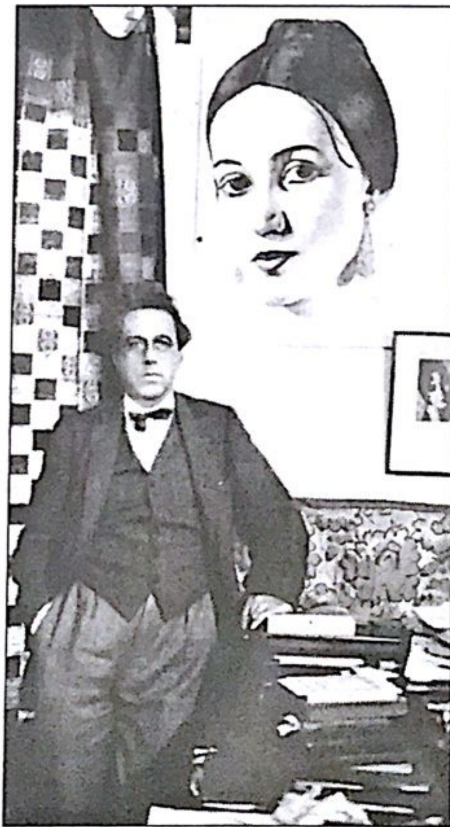
Всеволод Мейерхольд на фоне портрета Зинаиды Райх. 1930 г.