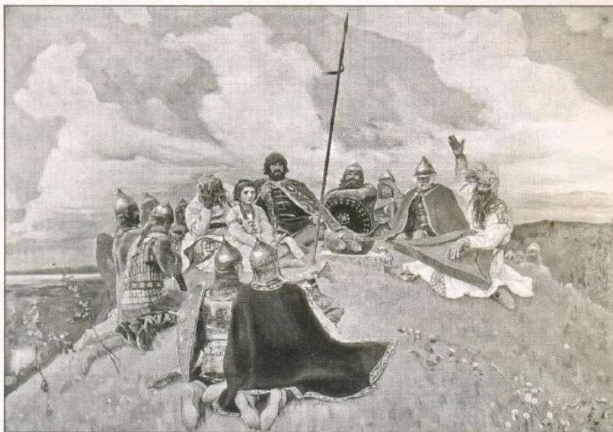
Баян. Художник В. Васнецов. 1910 г.

Поход начался 23 апреля 1185 г., князь Игорь выступил совместно с братом Всеволодом Святославичем и племянником Святославом Ольговичем. Накануне похода произошло солнечное затмение,