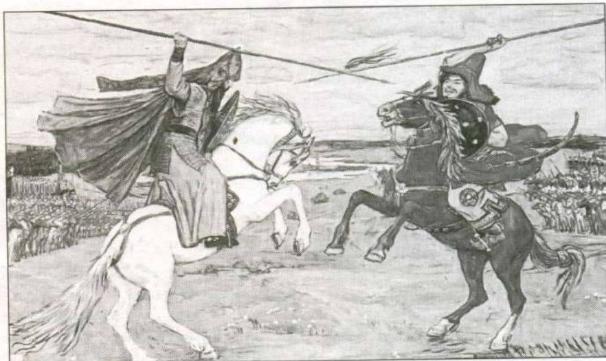
Поединок Пересвета с Челубеем. Художник В. Васнецов. 1914 г.

ИСТОРИК: После правления Ярослава Мудрого русское госу-