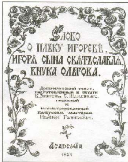
Титульный лист, украшенный растительным орнаментом и буквицей. Оформление художника И. Голикова. 1934 г.