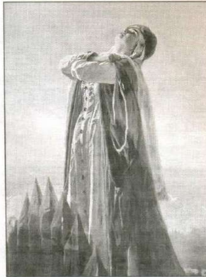
Плач Ярославны. Художник В. Перов. 1881 г.

ИСТОРИК: Поэтому закономерно, что в «Слове...» содержится множество отсылок к древней истории. Одна из самых явных — упоминание про «Траяновы века» и «Траянову тропу». Траян — это римский император, правивший во II в. В результате его завоеваний Римская империя стала непосредственной соседкой славянских народов. (Вопрос происхождения славян-