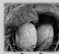
белый гриб (боровик)