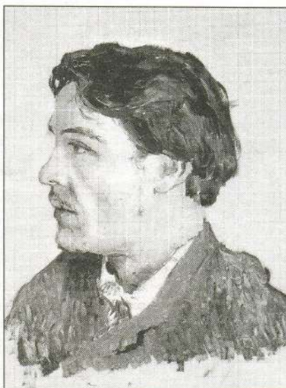
Антон Павлович Чехов. Художник И. Левитан. 1886 г.

5. «Мне кажется, что я его не понимаю и никогда не пойму. За всё время, пока я его невеста, он ни разу не улыбнулся, ни разу не взглянул мне прямо в глаза. Вечно жалобы, раскаяние в чём-то, намёки на какую-то вину, дрожь... Я утомилась. Бывают даже минуты, когда мне кажется, что я... я его люблю не так сильно, как нужно. А когда он приезжает к нам или говорит со мною, мне становится скучно». Героиня, испытывающая сомнения в любви. Назовите имя и произведение.