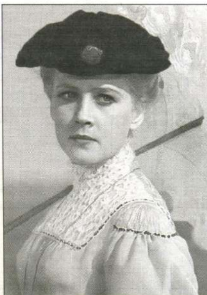
Познакомившись в Ялте с Гуровым, Анна Сергеевна (И. Саввина) поняла, что встретила настоящую любовь. Фильм «Дама с собачкой». Режиссёр И. Хейфиц. 1960 г.

(Представлены фрагменты из «Иванова» и «Драмы на охоте». В первом отрывке молодой земский врач Евгений Константинович Львов обращается к Николаю Алексеевичу Иванову с просьбой оказать должное внимание умирающей от чахотки Анне Петровне. Молодого доктора поражает, с каким бессердечием муж относится к тяжелобольной жене. «У несчастной жены всё сча-