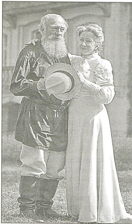
Софья Андреевна (Х. Миррен) была верной супругой и помощницей писателя (К. Пламмер). Фильм «Последнее воскресенье». Германия — Великобритания — Россия, режиссёр М. Хоффман. 2009 г.

ЛИТЕРАТУРОВЕД (с улыбкой): Друзья, интересное мы для вас задание придумали?