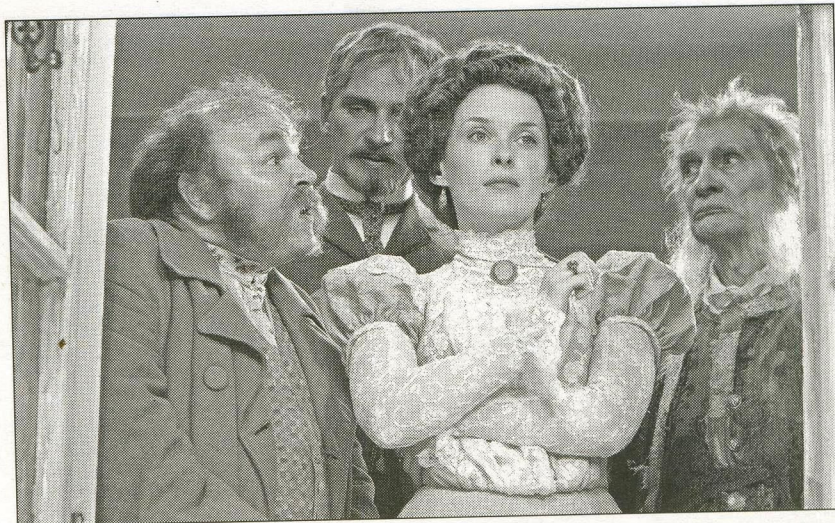
Раневская (А. Вартаньян) не мыслит свою жизнь без любимого вишнёвого сада, но после торгов смиряется с потерей и уезжает в Париж. Фильм «Сад». Режиссёр С. Овчаров. 2008 г.

2. Прочитайте монолог Раневской во втором действии, ответьте на вопросы.