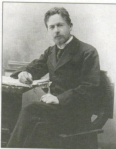
Антон Павлович написал 18 повестей, 14 пьес и более 150 рассказов. 1889 г.

(Команды занимают свои места. На столе разложены карточки с вопросами (по цвету секторов), в центре волчок. Капитаны тянут жребий, определяя очередность хода. Затем каждая команда вращает волчок и выбирает вопрос. На формулирование ответа у игроков есть ровно одна минута. В случае неверного или неполного варианта вопрос переходит к соперникам. Отвечает та команда, которая первой поднимет сигнальный флажок. Игра идёт до шести очков. Примечание: в каждой рубрике добавлено по одному запасному вопросу.)