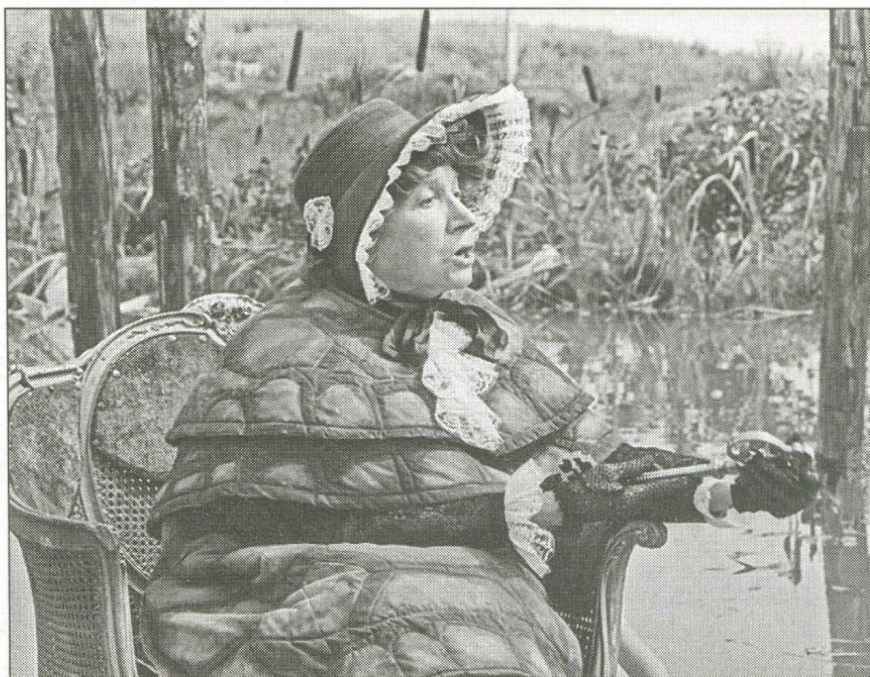
Мудрая черепаха Тортила в исполнении Р. Зелёной была неподражаема, хотя актриса рассказывала, что сильно мёрзла во время ноябрьских съёмок на пруду. Фильм «Приключения Буратино». Режиссёр Л. Нечаев. 1975 г.

«Температура воздуха плюс восемь, вода — плюс четыре, а я в тонкой курточке сижу на листе «кувшинки», который лежит на обычной надутой камере. В общем, пару раз перевернулся», — вспоминал потом Дмитрий Иосифов.