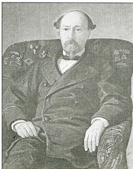
Портрет поэта Н.А. Некрасова. Художник Н.Н. Ге. 1872 г.

Некрасов отправляется домой. Все его мысли уже занимал Петербург, ведь Николай мечтал о поступлении в университет. Отец согласился отпустить сына в столицу, но при одном условии: